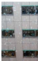
DSA 大賞 「霧はれて光さる春」 (ハナムラ チカヒロ/大阪府立大学 21 世紀科学研究機構)