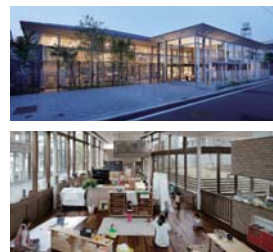
JCD 大賞 「まちの保育園」 (宇賀亮介/宇賀亮介建築設計事務所)