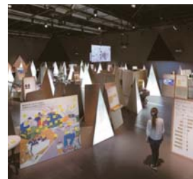
SDA 大賞 「日本科学未来館企画展 世界の終わりのものがたり もはや逃れられない 73 の問い」 (氏デザイン株式会社)