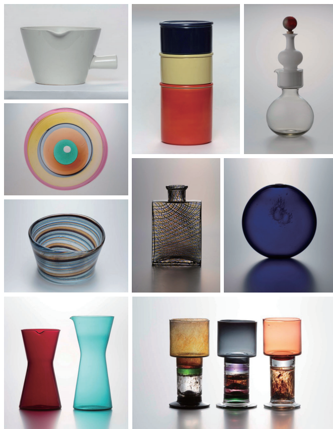
カイ・フランク作品 タウノ・タルナ氏コレクション

フィンランドと日本は、四季や自然を愛でる、機能性、シンプルなデザインを好む、上質な匠の技を持つなど多くの共通点があります。でも日々の暮らしの楽しみ方やデザインへの理解度は、日本はまだ充分とは言えないのが現状です。「世界一幸福な国フィンランド」から学ぶことが数多くあるはず。「デザインとはデザイナーが名を残すためにあるのではなく、人々の日常で長く使われ必要とされるためにある」というカイ・フランクのデザイン思想やフィンランド文化を通じて、日々の暮らしの楽しみ方のヒントやテーマ“暮らしを変えるデザイン”を考える機会になれば幸いです。