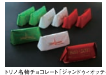
トリノ名物チョコレート「ジャンドウィオッティ」