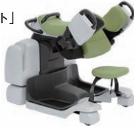
Care Assist Robot