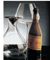
ピエモンテ産赤ワイン